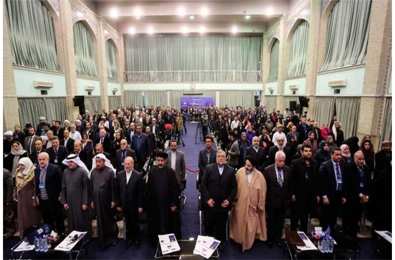
افتتاح مؤتمر الحوار الثقافي بين إيران والعالم العربي