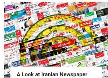
A Look at Iranian Newspaper Front Pages on February 21