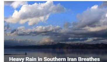
Heavy Rain in Southern Iran Breathes