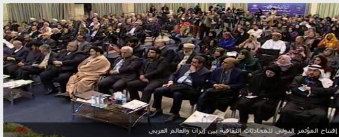
إفتتاح المؤتمر الدولي للمحادثات الثقافية بين إيران والعالم العربي